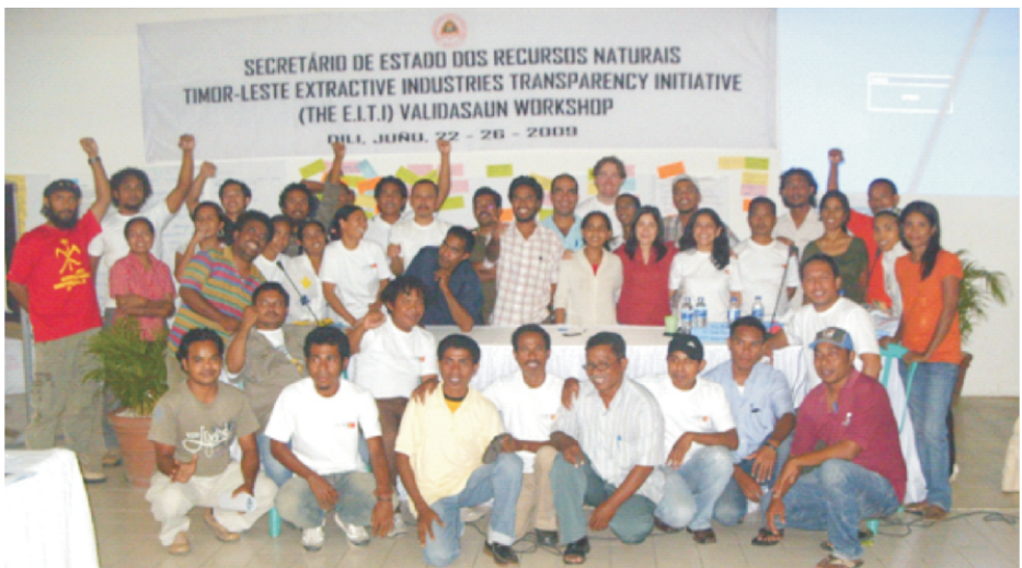
Alfredo Pires Secretário de Estado dos Recursos Naturais

A sociedade civil é um elemento importante no processo da EITI. Nesta imagem notamos a participação de NGO's locais dos 13 distritos de Timor-Leste que participaram num dos colóquios da EITI organizado em Timor-Leste.